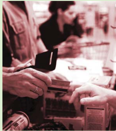
Banking & Finance