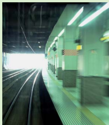
Airport & Railways