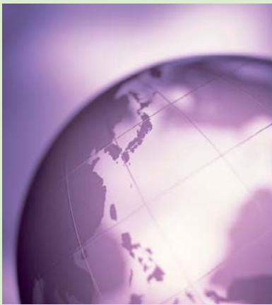
PBSI: A Global Network.